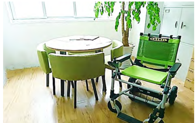
応接室には電動車いす「RASREL」を展示